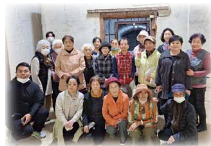
手安弾薬庫跡 庫内で撮影しました

で最も古い軍事施設 明治24年建造」と手安弾薬庫(旧大日本帝国陸軍が建造した施設で戦前の1932年に完成)車内では、奄美大島に関する戦争の記録などが紹介され、目的とした平和を継承していく決意を深める戦跡巡りとなりました。