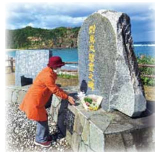
慰霊碑に献花を行い 全員で黙とうしました

資料によると犠牲者は疎開者(学童集団疎開) 784名、疎開者(訓練・世話人) 30名、疎開者(一般疎開) 625名、船舶砲兵隊員21名、合計1,484名(0才~15才は、1,040名)となっていますが、明確な数はいまだ不明です。