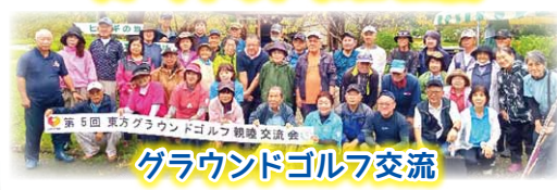
グラウンドゴルフ交流