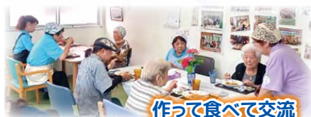
作って食べて交流