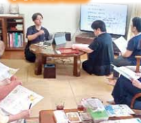
医師による医療学習