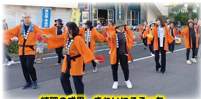
練習の成果 きれいにそろった