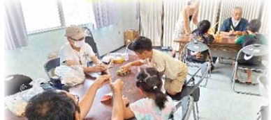
手熟師会と子どもたちが ものづくりに挑戦 (子ども応援企画)