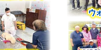
保健学校 (3区で開催)