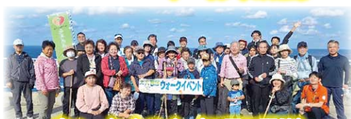
ウォークイベント (3区で開催)