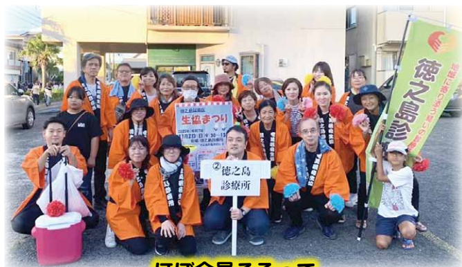
ほぼ全員そろって