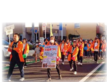
元気な徳之島診療所をアピール