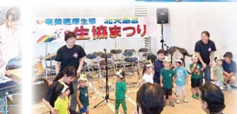
生協まつり (3区で開催)