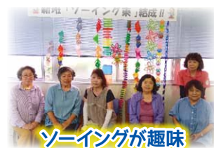
ソーイングが趣味

つながるう・ひろげよう・ともにつくる協同の「わ」を テーマに秋の生協強化月間がとくまね、多くの仲間を 組合員として迎えることができました。奄美医療生協の 組合員活動は、健康づくりや学習会、趣味の交流、祭り 等楽しい企画が取り組まれていきます。組合員活動に参加 することで「医療福祉生協の魅力」を深く実感すること ができます。ご参加をお待ちしております。