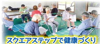
スクエアステップで健康づくり