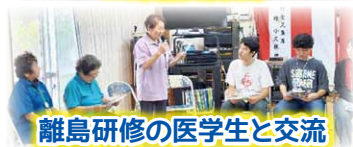
離島研修の医学生と交流