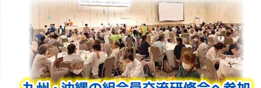
九州・沖縄の組合員交流研修会へ参加