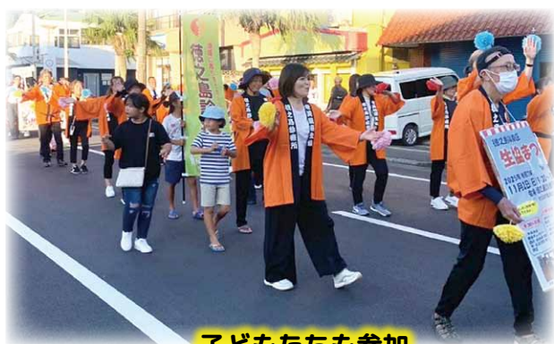
子どもたちも参加