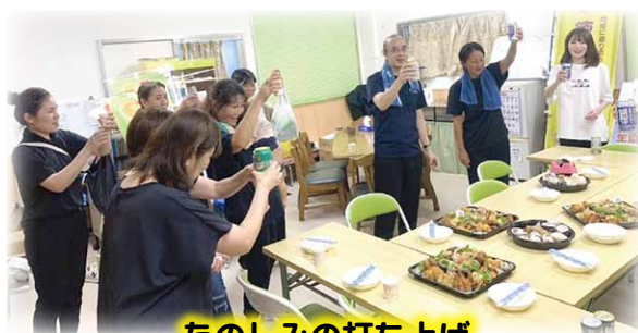
たのしみの打ち上げ