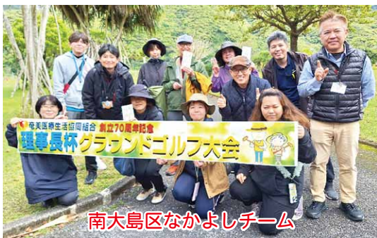
南大島区なかよしチーム