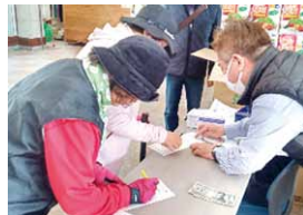
組合員加入を訴えました。